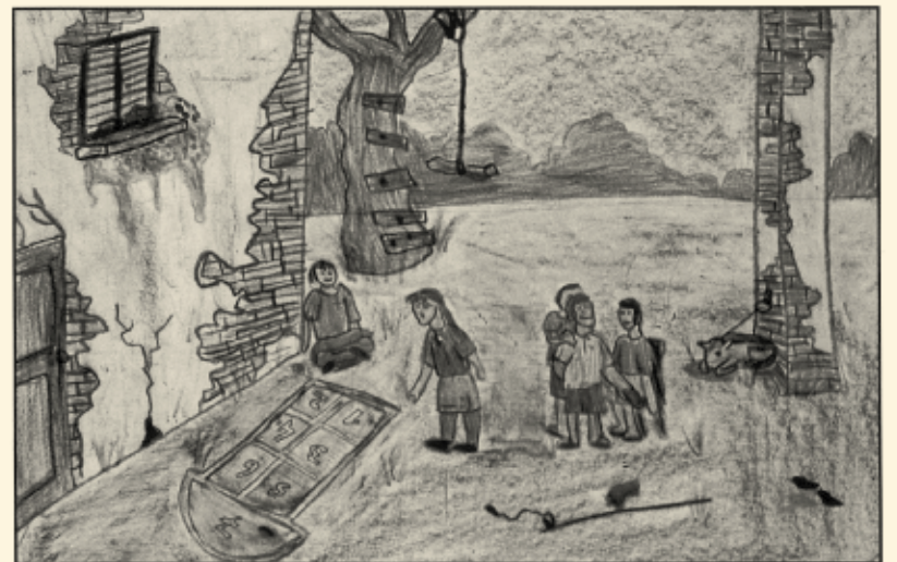
Il gioco della campana. Illustrazione tratta dal libro "Na òlta sa sbatia vià niènt, BAMS Edizioni, maggio 1999, a cura del CECAB, Centro culturale Agostino Bianchi.

Forse un po' della sinistra fama che ci accompagnava era figlia dell'eco di gioco-scontri troppo rudi.