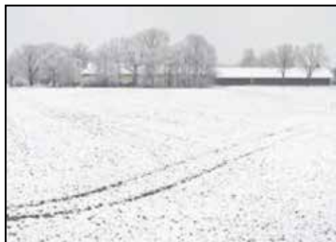
La campagna innevata.

Un po' controversi questi proverbi: "a San Sebastia la viôla èn mà"(20 gennaio) e "a Sant'Agnes la lözerta dré a lasés"(21 gennaio), come se facesse già abbastanza caldo per far sbocciare le viole e far uscire al sole le lucertole... Simile il detto del 2 febbraio "a la Ma-