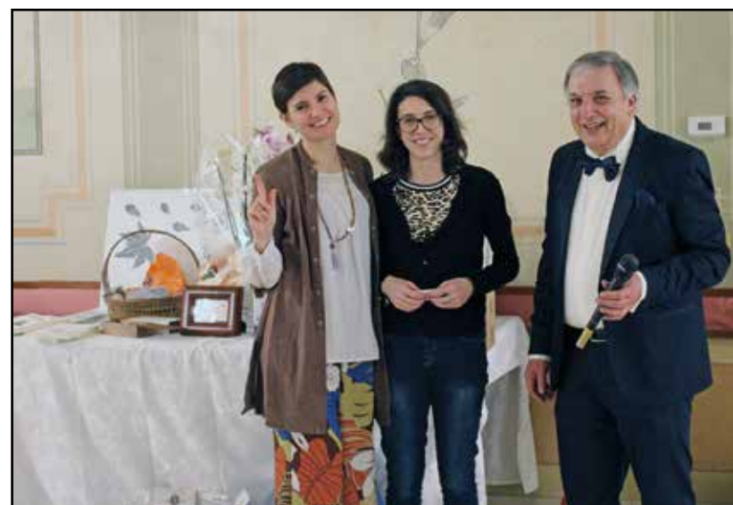
I "responsabili" della lotteria.

Da parte dell'Eco un grazie particolare a tutti coloro che hanno contribuito al successo della serata in particolare alle maestranze del Green Park Boschetti.